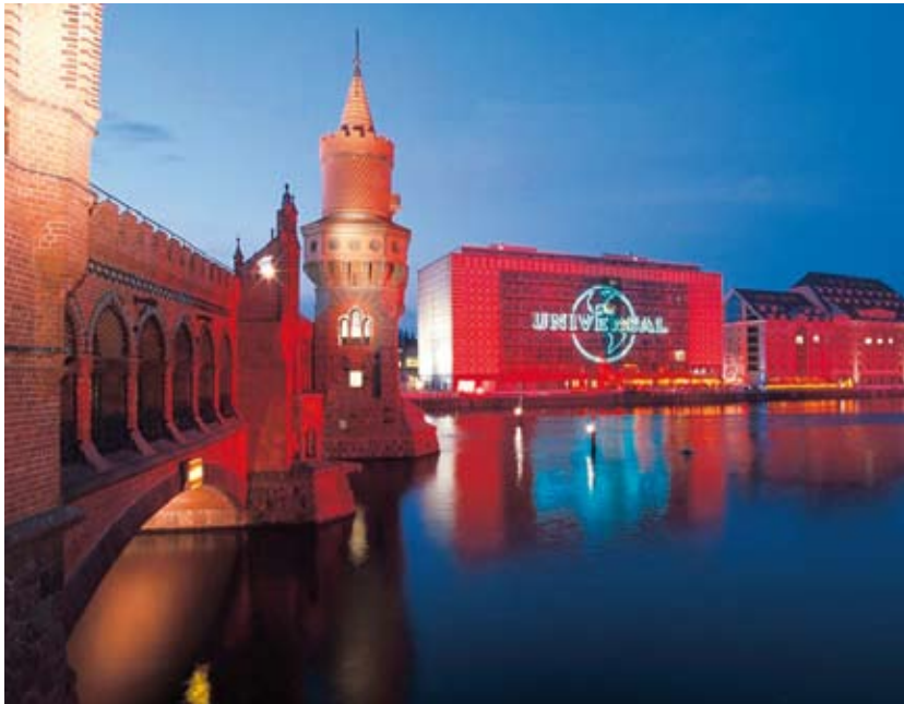
Berlin: Hauptsitz von Universal Music Deutschland, MTV und VIVA