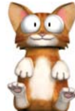
»kitty« von the binary family: animago AWARD Gewinner in der Kategorie »Beste Mobilproduktion«