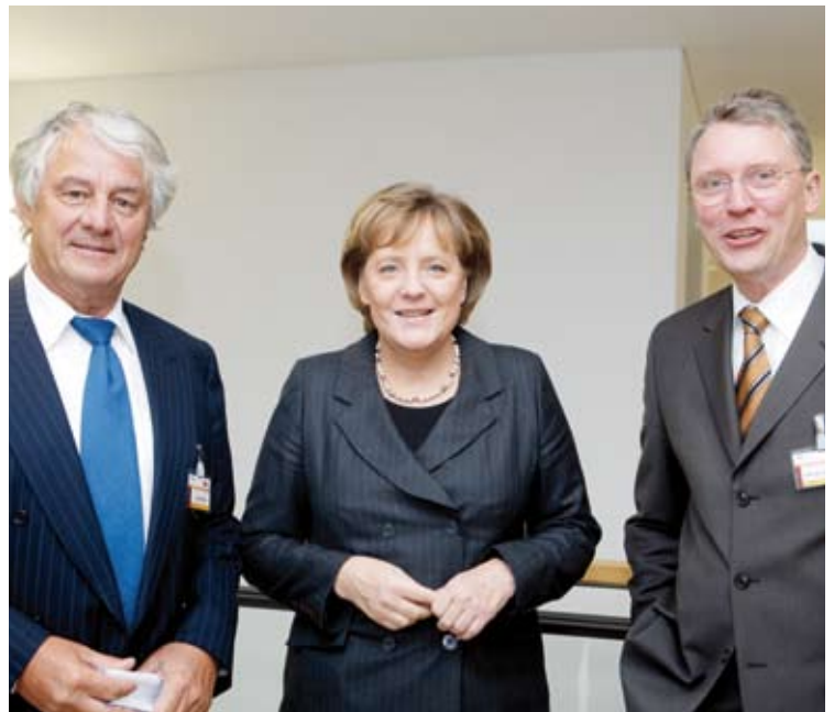
1. Nationaler IT-Gipfel unter der Leitung von Bundeskanzlerin Angela Merkel am Hasso-Plattner-Institut, Potsdam