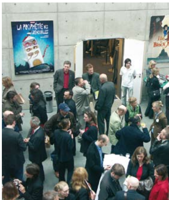
Netzwerkveranstaltung im fx.Center, Potsdam-Babelsberg