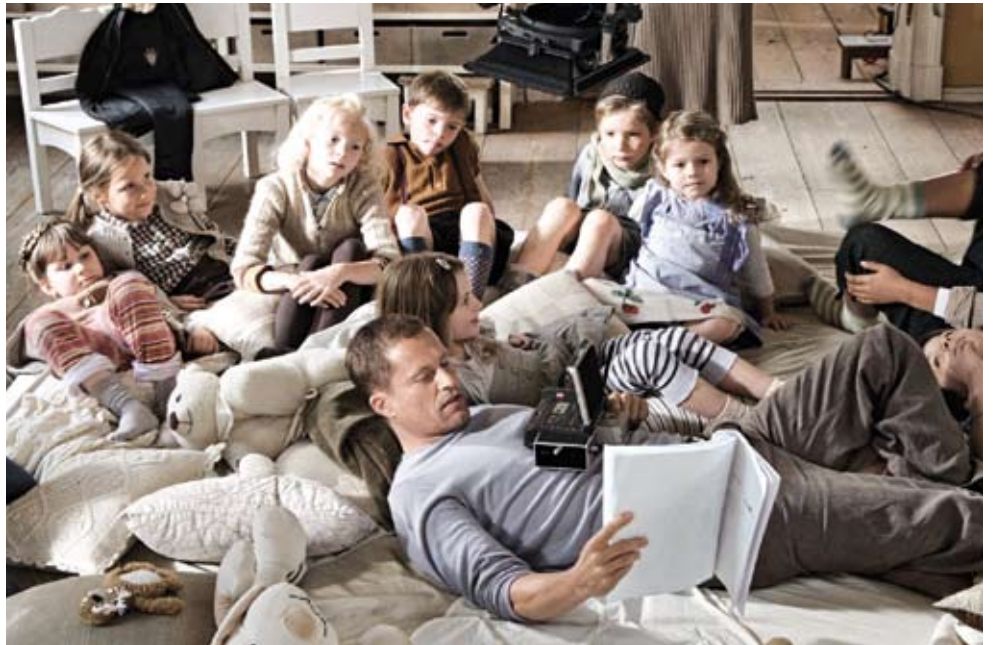
Erfolgskomödie »Zweihrküken« von und mit Til Schweiger