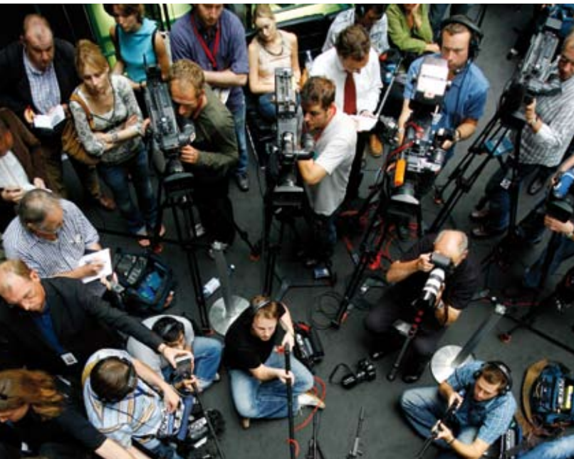
Berlin – Hauptstadt des politischen Journalismus