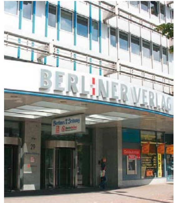
Berliner Verlagshaus am Alexanderplatz, Berlin