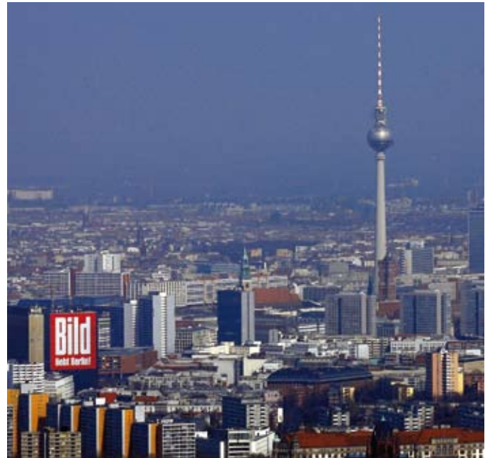
Berlin: Sitz der Axel Springer AG