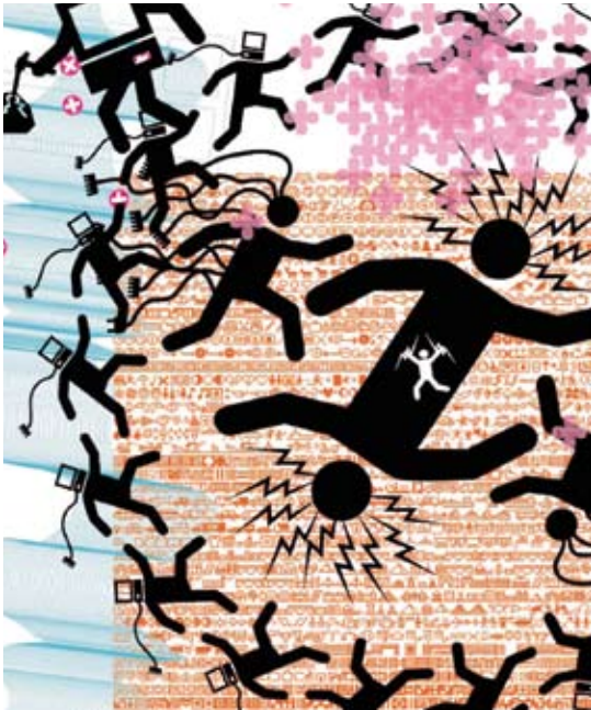
Designmai, Teil des DMY International Design Festivals