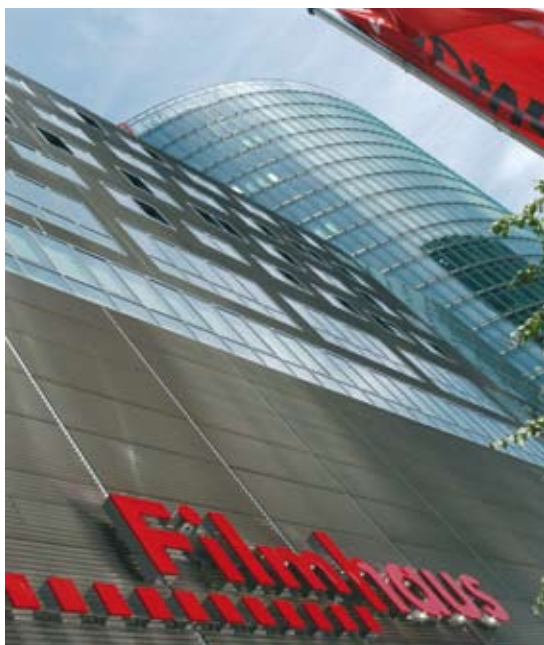
Filmhaus am Potsdamer Platz in Berlin, Sitz der dffb