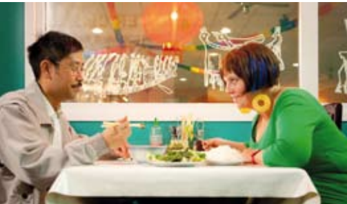
»Die Friseur« von Doris Dörrie