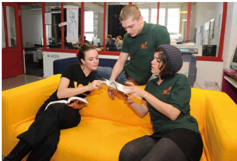
Studenten der Games Academy, Berlin