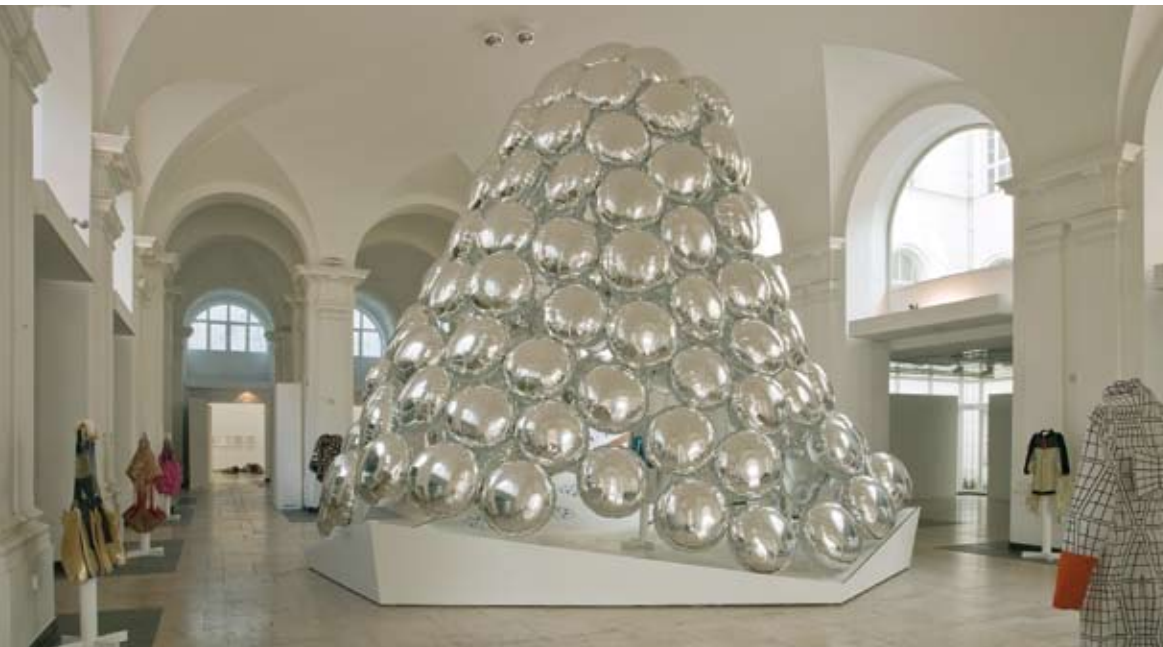
Universität der Künste, Berlin