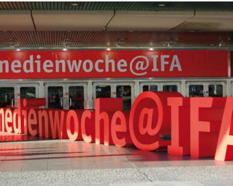
medienwoche@IFA, ICC Internationales Congress Centrum Berlin