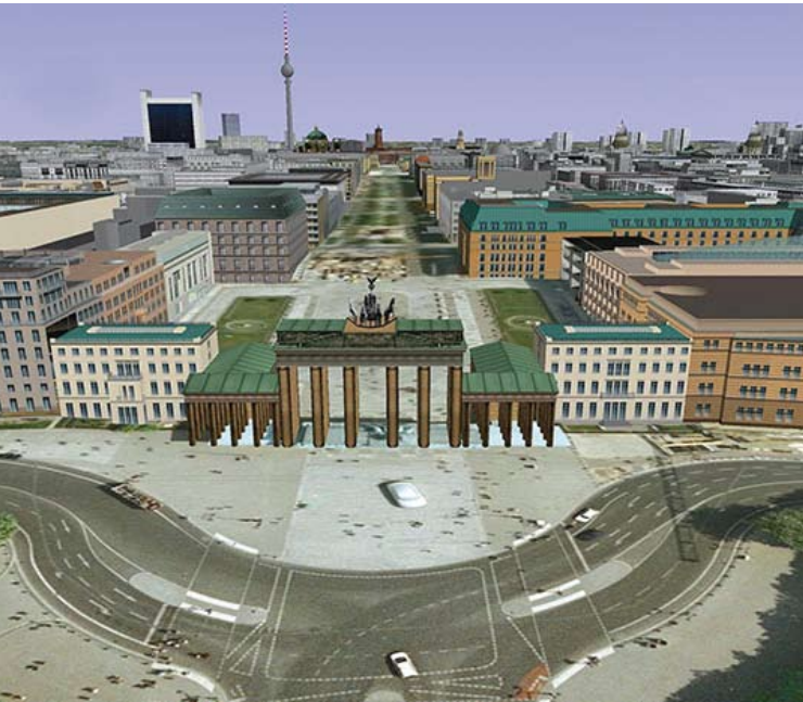
Das Brandenburger Tor in Berlin 3D