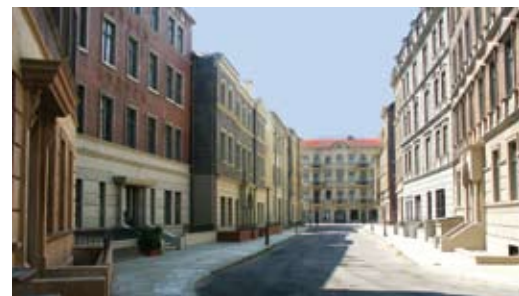
Berliner Straße, Studio Babelsberg