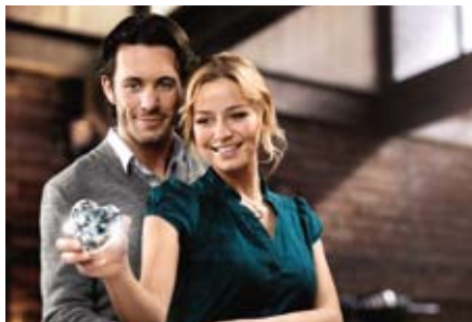
Telenovela »Alisa – Folge Deinem Herzen« (ZDF)