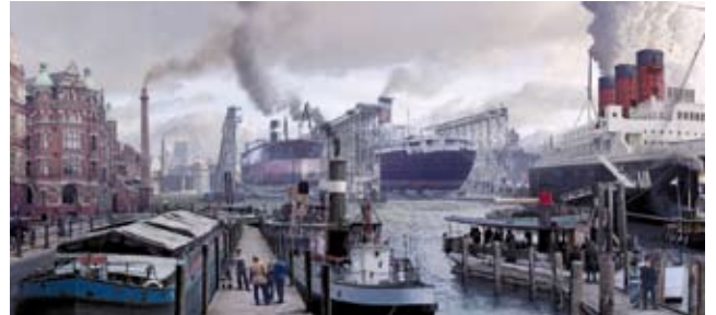
»Das Blaue Band« von exozet