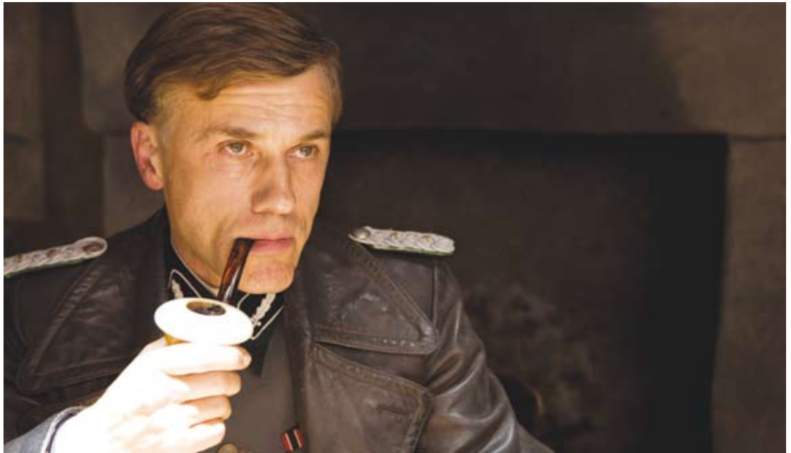
»Inglourious Basterds« von Quentin Tarantino mit Brad Pitt und Oscar®-Preisträger Christoph Waltz