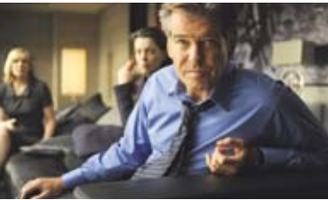
»Der Ghostwriter« von Roman Polanski mit Pierce Brosnan