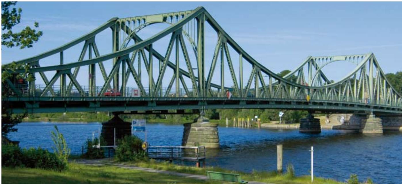
Die Glienicker Brücke verbindet Berlin und Brandenburg.