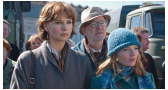
»Das Wunder von Berlin« (ZDF) von Roland Suso Richter mit Veronica Ferres