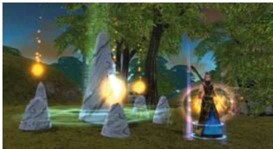
»Runes of Magic« von Frogster Interactive Pictures