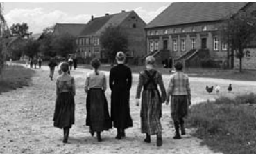
Golden-Globe-Gewinner »Das weiße Band« von Michael Haneke