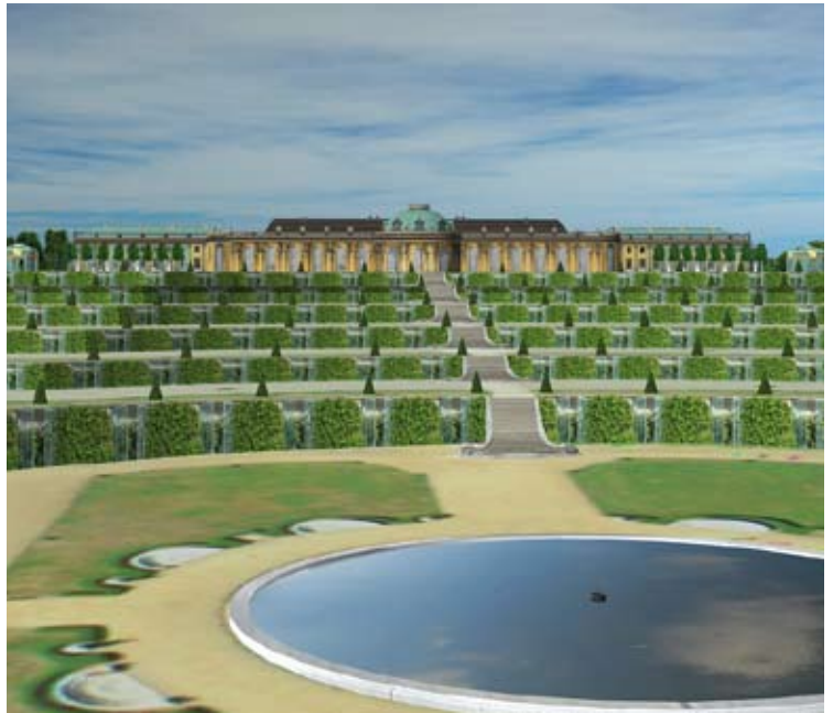
Schloss Sanssouci in Potsdam 3D