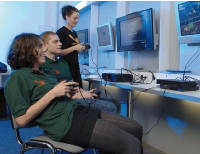
Studenten der Games Academy Berlin