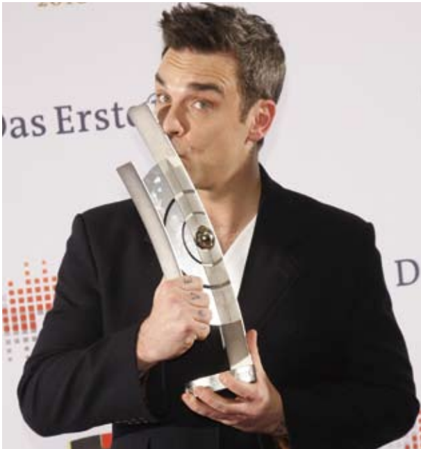
Robbie Williams, ECHO Gewinner 2010 »Bester Künstler International Rock/Pop«