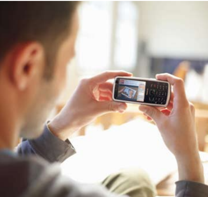
Mobile TV-Player von dailyme.tv