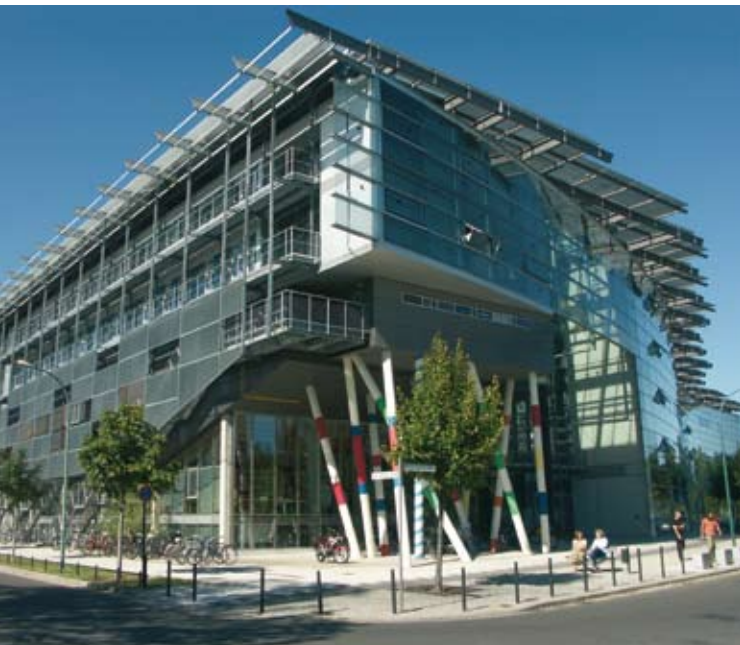
Hochschule für Film und Fernsehen »Konrad Wolf« (HFF), Potsdam-Babelsberg