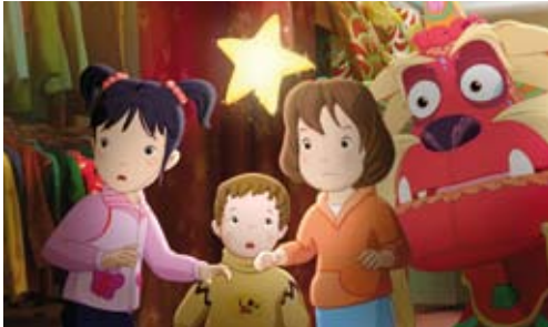
»Lauras Stern und der geheimnisvolle Drache Nian« von Cartoon-Film