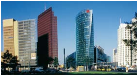
Potsdamer Platz, Berlin