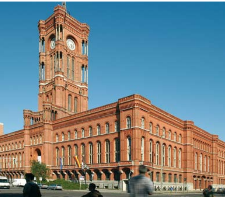
Rotes Rathaus, Berlin