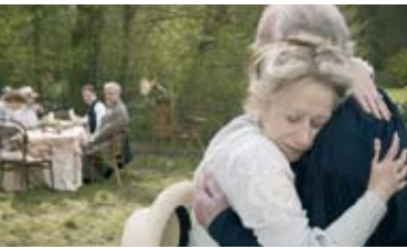
»Ein russischer Sommer« von Michael Hoffmann mit Helen Mirren