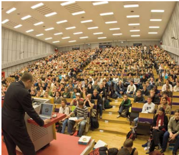
Campus der Technischen Universität Berlin