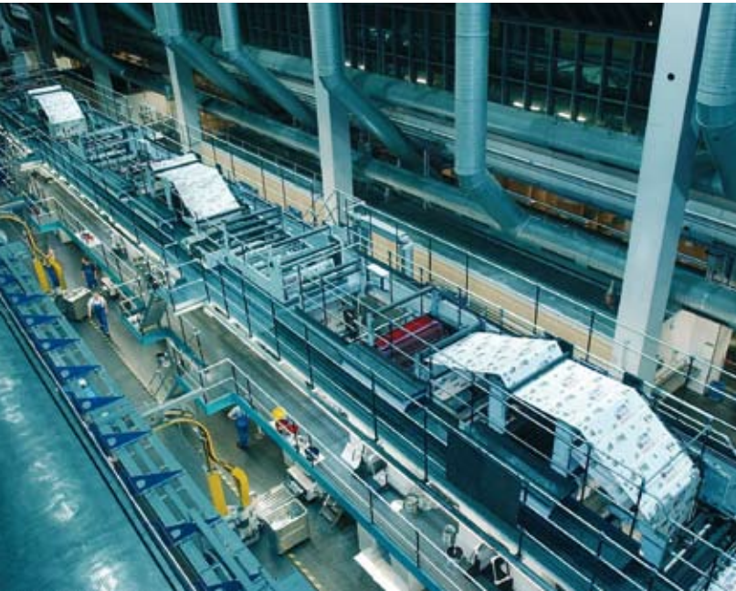
Druckerei der Märkischen Allgemeinen Zeitung, Potsdam