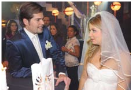
Daily Soap »Gute Zeiten – Schlechte Zeiten« (RTL)