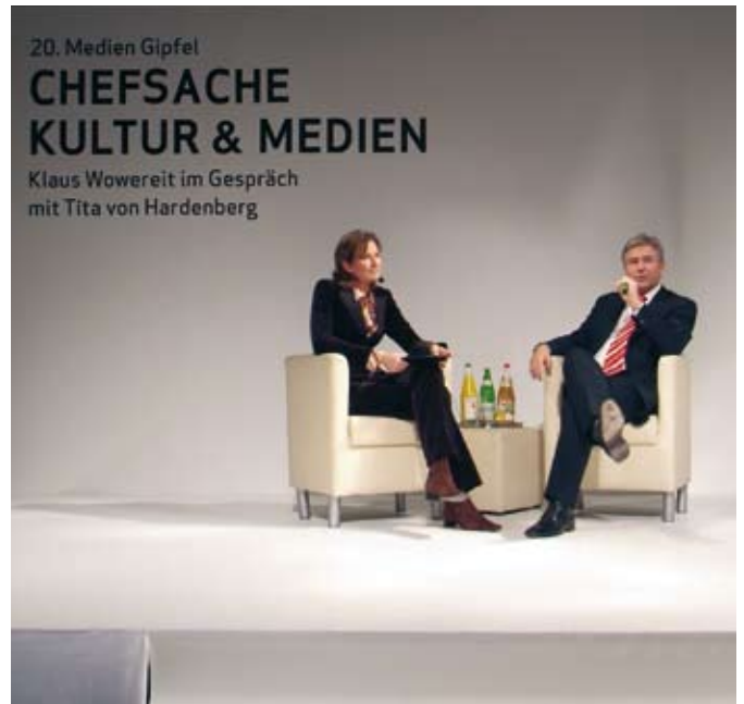
mediengipfel mit Klaus Wowereit