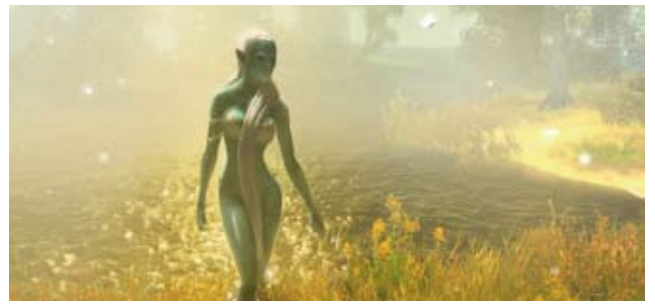
»Drakensang« von Bigpoint Berlin, ausgezeichnet mit dem Deutschen Computerspielpreis