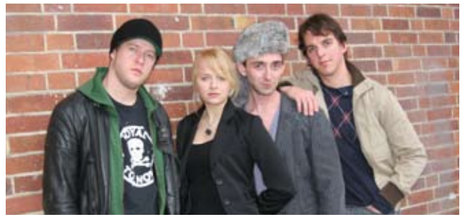
Webserie »Wir sind größer als groß« von Grundy UFA und MySpace