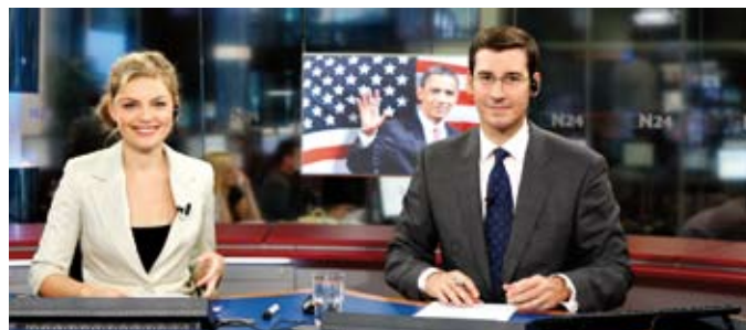
N24-News live aus Berlin