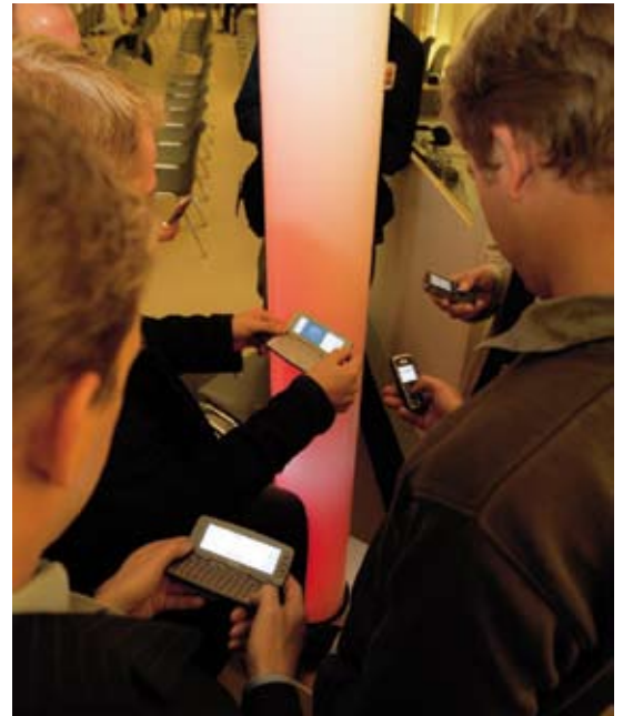
Bluetooth-Säule »Beamzone®« auf der medienwoche@IFA