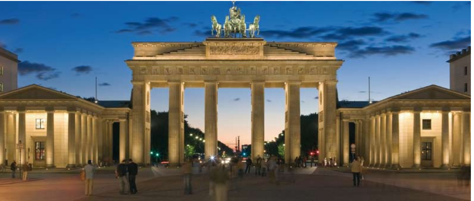
Brandenburger Tor, Berlin