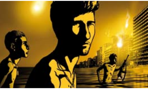
»Waltz with Bashir« von Ari Folman