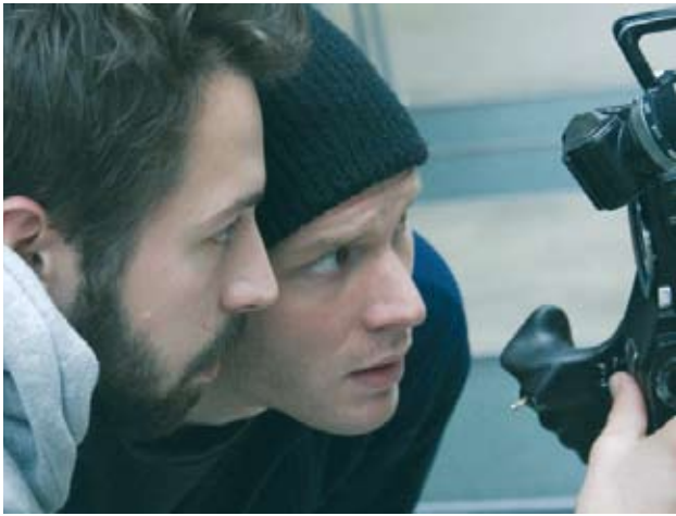
Studenten der HFF, Potsdam