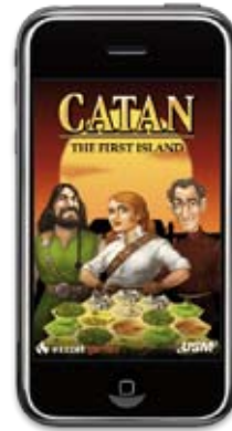
Mobile Game: »Catan – die erste Insel« von exozet games