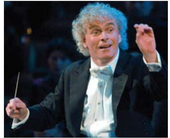
Sir Simon Rattle, Chefdirigent der Berliner Philharmoniker