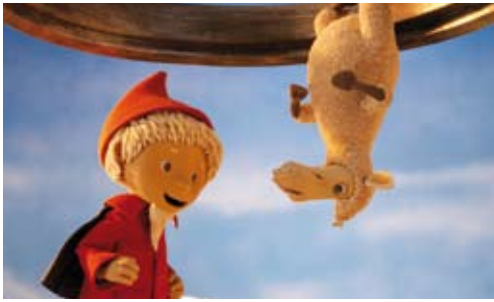
»Der Sandmann und der verlorene Traumsand« von Scopas Medien