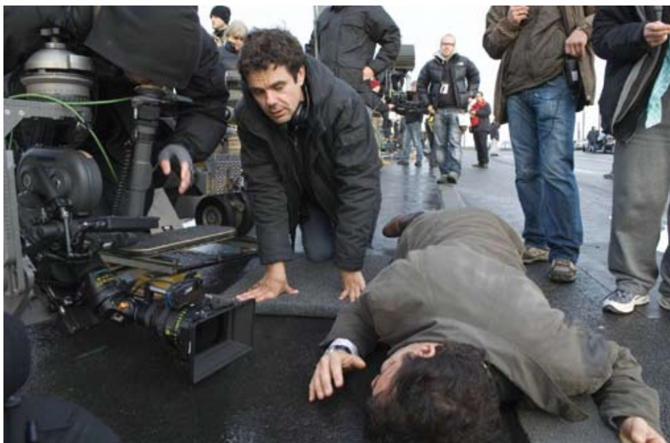
»The Internationalk: Regisseur Tom Tykwer bei den Dreharbeiten mit Clive Owen in Berlin