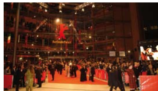
Der Berlinale Palast am Potsdamer Platz, Berlin