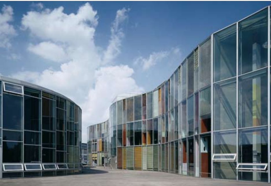
Zentrum für Fototechnik und Optische Technologien (Photonikzentrum, auch »Amöbe« genannt), Berlin-Adlershof