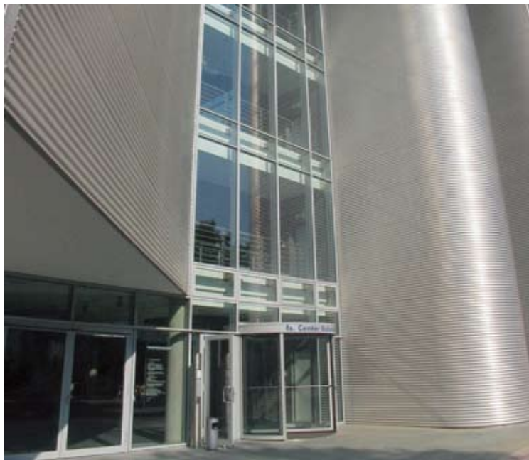
fx.Center in Potsdam, Sitz des Medienboard Berlin-Brandenburg