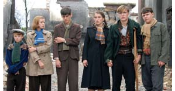
Emmy Award-Gewinner »Die Wölfe« (ZDF) von Friedemann Fromme