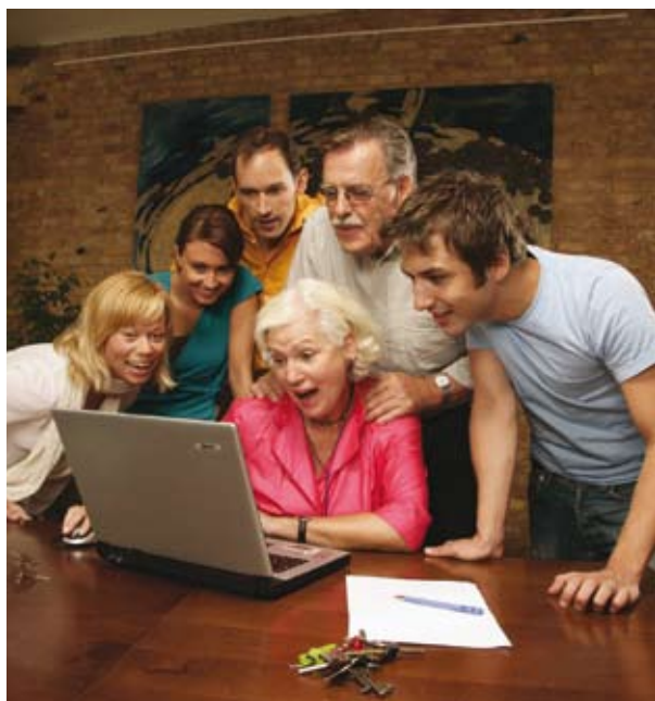
GameDuell – Deutschlands größtes Spieleportal