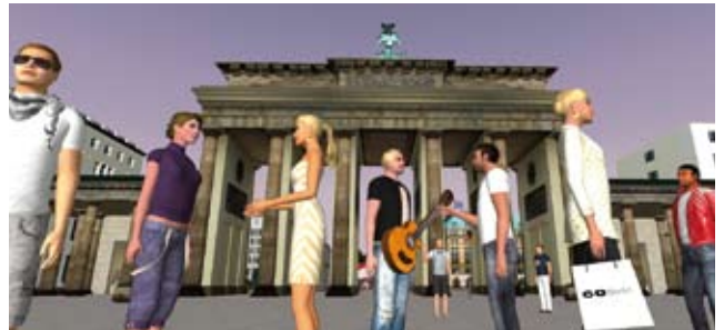
Die Online-Plattform »Twinity« von Metaversum