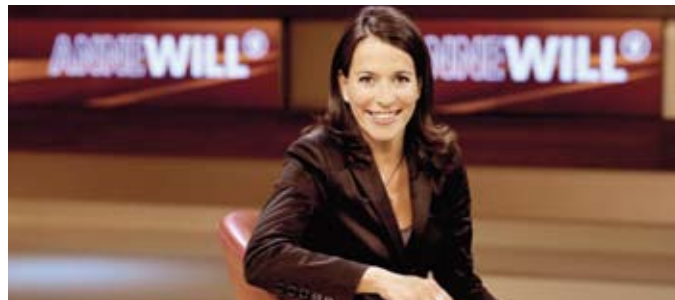
»Anne Will« (ARD)